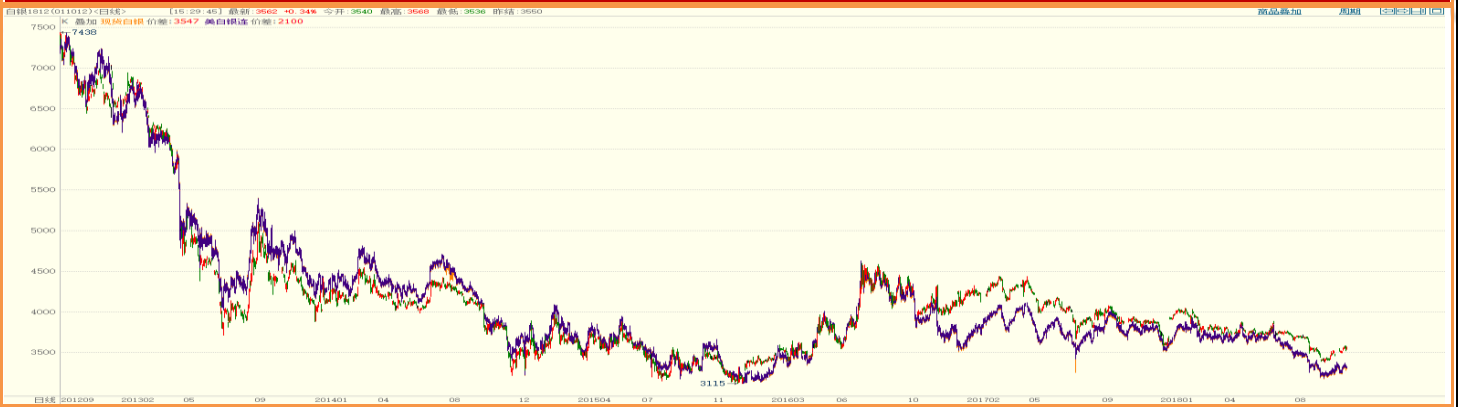
图 3: 沪银，伦敦银，美白银 K 线叠加图（2012.09-2018.10）

从长期来看，沪银与伦敦银相关性系数为 0.863，沪银与美白银相关性系数为 0.889，因此，内外盘走势大致趋同。