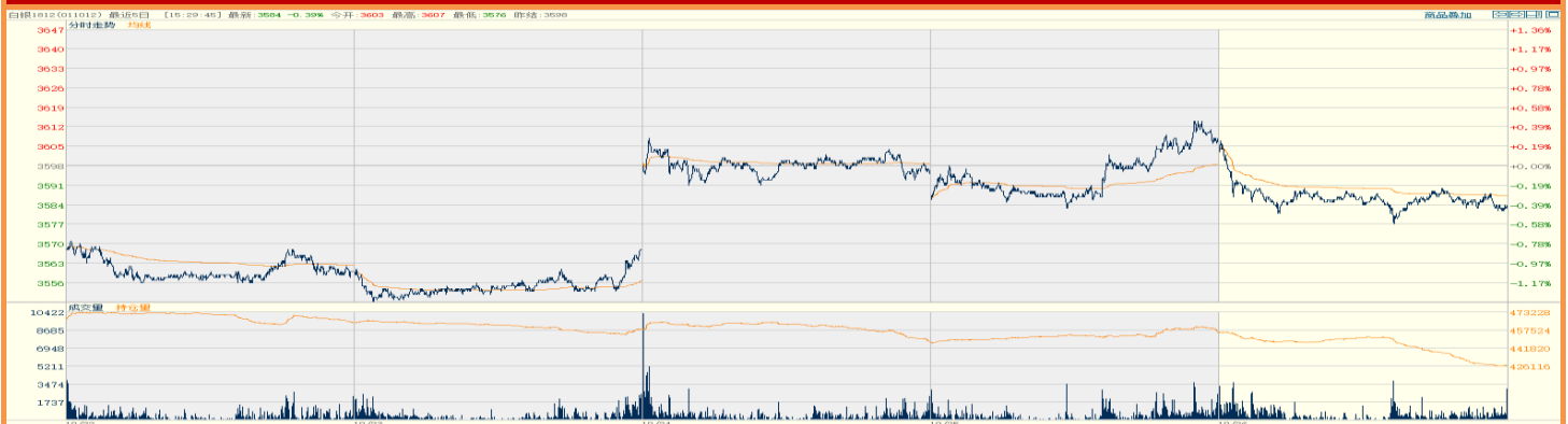
图 1：白银 1812 分时走势图（2018.10.22-2018.10.26）

本周，AG1812 整体表现为震荡上行，验证了上周报告中继续上涨的判断。开于 3568 元/千克，收于 3584 元/千克，最高至 3617 元/千克，最低至 3547 元/千克。上涨 22 元/千克，涨幅 0.62%。本周成交 1115202 手，持仓 427062 手，较节前一周减仓 40482 手，换手率 2.62（前值 2.84），市场活跃度略有下降。