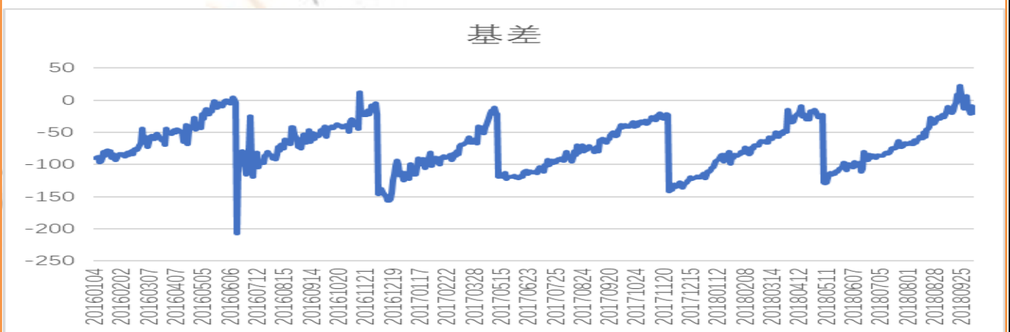
图 4: 沪银基差（2016.01-2018.10）