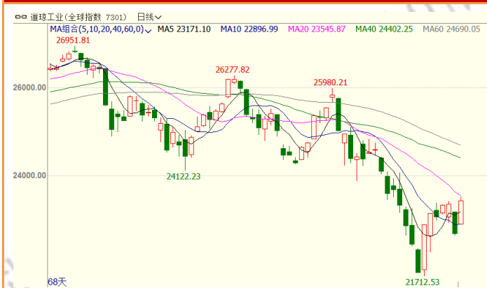
图 1：道琼斯工业指数日 K 线图